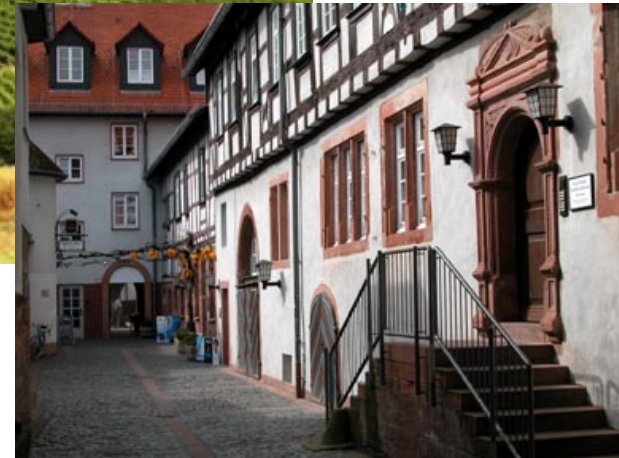
Groß-Umstadt, die „Odenwälder Weininsel“