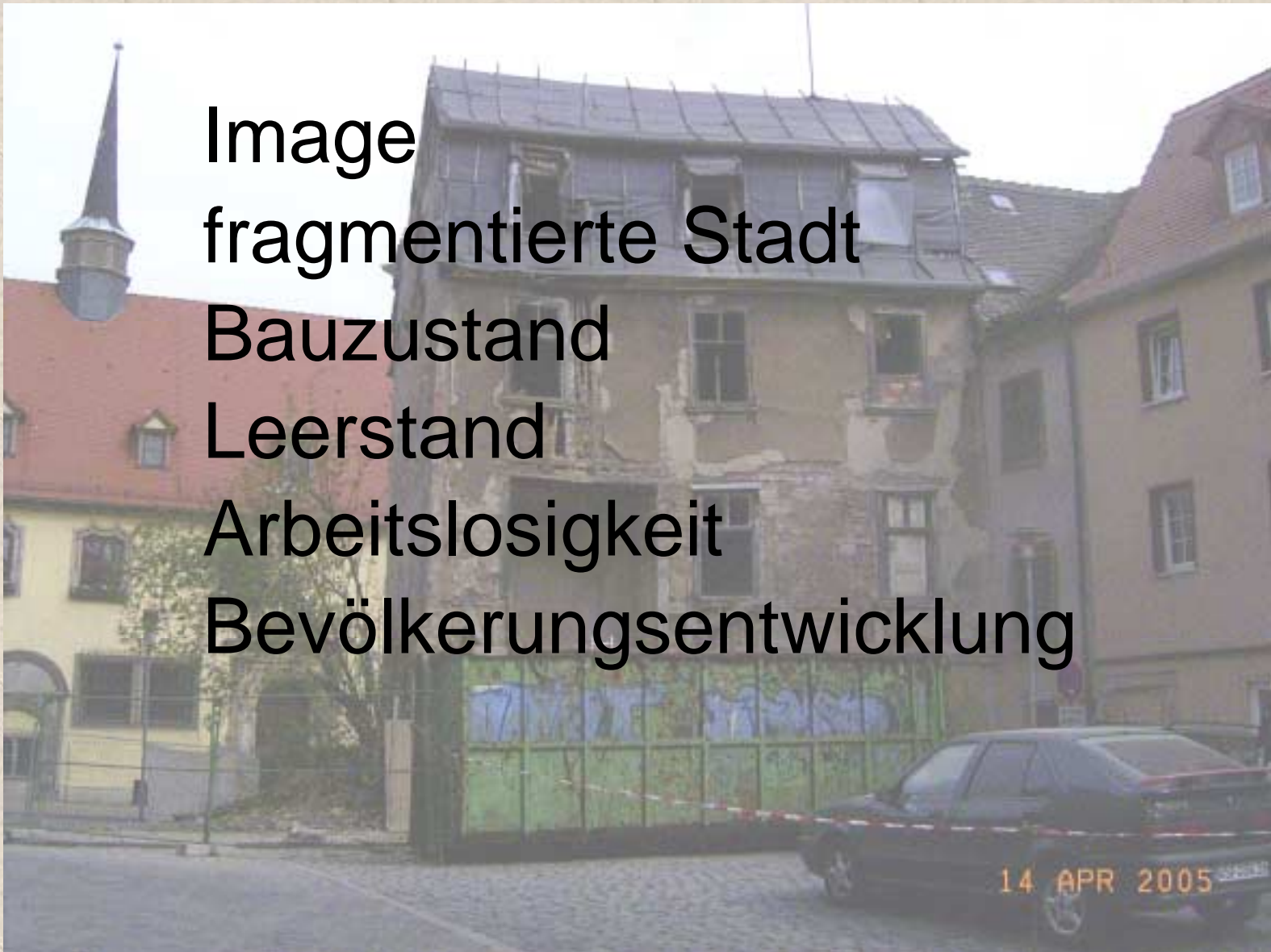
Image fragmentierte Stadt Bauzustand Leerstand Arbeitslosigkeit Bevölkerungsentwicklung