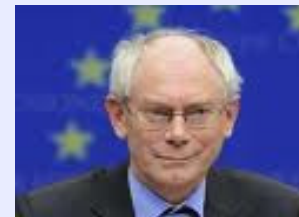
Herman van Rompuy, ständiger Präsident des Europäischen Rates