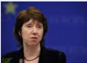
Catherine Ashton, Hohe Vertreterin der Union für Außen- und Sicherheitspolitik