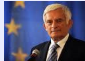
Jerzy Buzek, EU-Parlamentspräsident