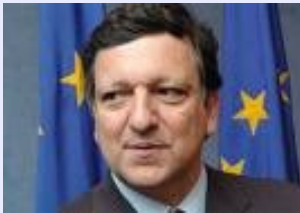
José Manuel Barroso, Kommissionspräsident